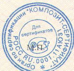
Схема сертификации №3а. Сертификат ISO 9001:2008 № MMR 229 от 12.06.2009 г., выданный EUROCERT со сроком действия до 12.06.2012 г.